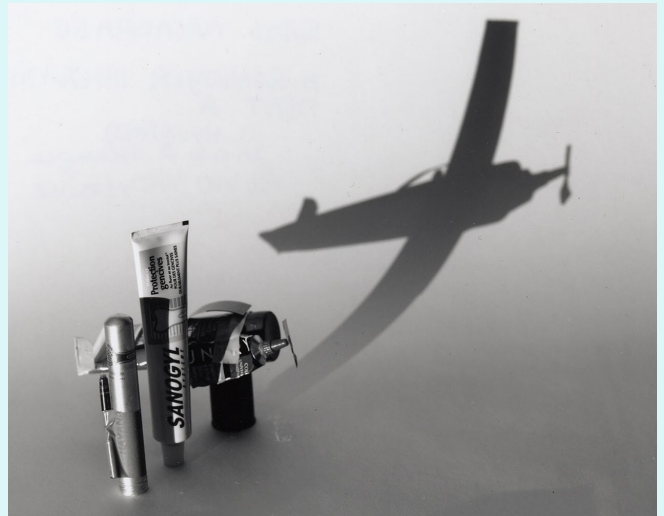
Mon bolide de scories , 1993, Colette Hyvrard de la série « sculptures »