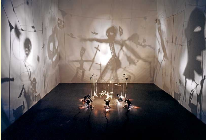
Danse macabre, théâtre d'ombres de Christian Boltanski, 1984, installation, métal, du carton, du papier, du laiton, du fil de fer, des projecteurs et un ventilateur

Les références ne sont pas des exemples à suivre pour faire le travail mais constituent des apports à la culture artistique et sont en lien avec les notions du sujet.