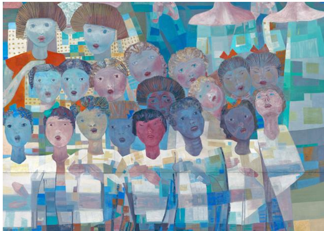
Candido Portinari, détail de la peinture murale "Paix", Choeur d'enfants