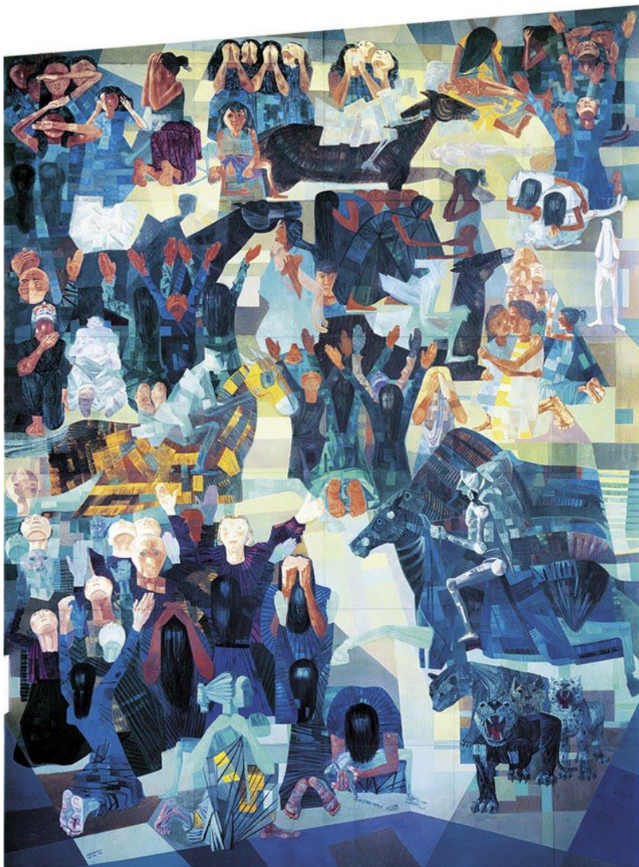
« Guerre et paix », Candido Portinari (1903-1962, Brésil), 1952-1956, 2 fois 14x10m