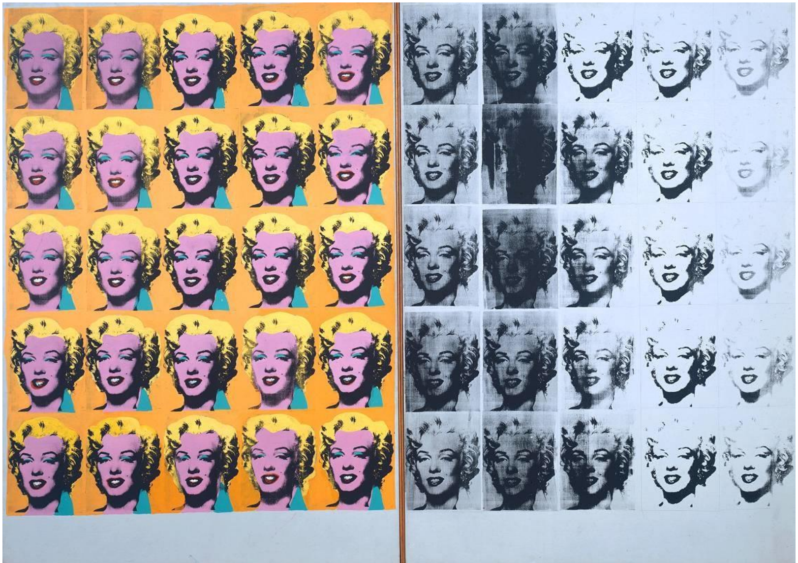
Diptyque Marilyn , Andy Warhol, 1962, 205 x 144 cm, sérigraphie, acrylique sur toile