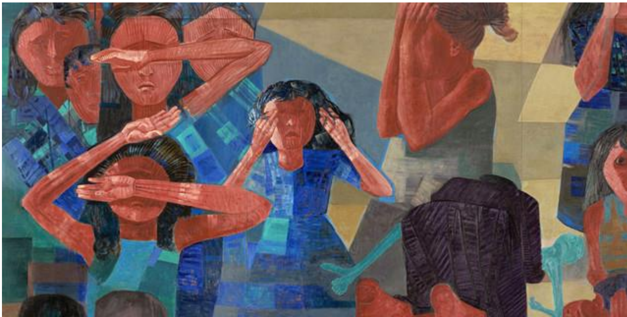
Candido Portinari, détail de la peinture murale "Guerre" : Femmes qui ne veulent pas voir