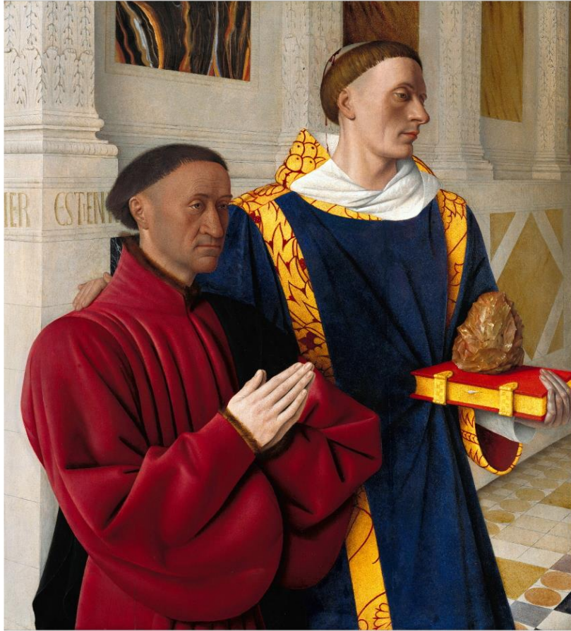
Diptyque de Melun , Jean Fouquet, vers 1452 , 2 panneaux de 91x81cm